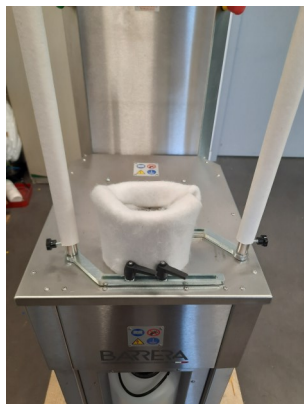
Référence kit : 644.10016